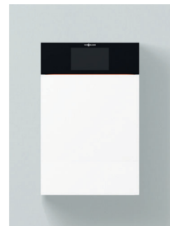
Komfortable Bedienung auf Augenhöhe durch nach oben versetzbares Display

Die Geräte sind für Erd- und Flüssiggas nach EN 15502 geprüft und zugelassen.